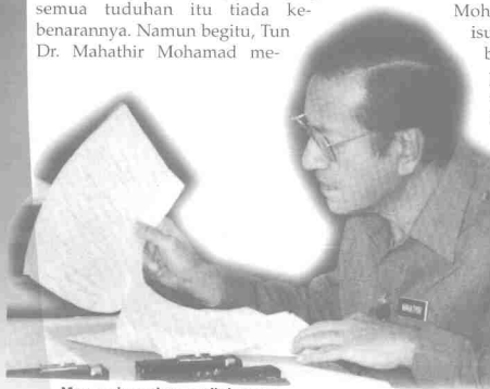
Memperjuangkan nasib bangsa

Antara cabaran pertama dialami sebaik sahaja menjawat jawatan Perdana Menteri ialah apabila beliau dikatakan antara individu terkaya di dunia. Ramai para pengkritik yang mengakui kekayaannya, walaupun semua tuduhan itu tiada kebenarannya. Namun begitu, Tun Dr. Mahathir Mohamad me-