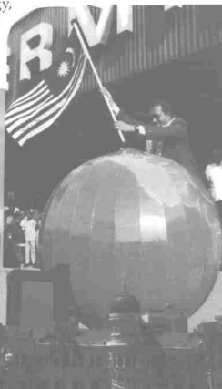
Memajukan negara menjadi agenda penting Tun Dr. Mahathir

Telephone Corp., termasuklah Hope Plantations Bhd. dan MDC.