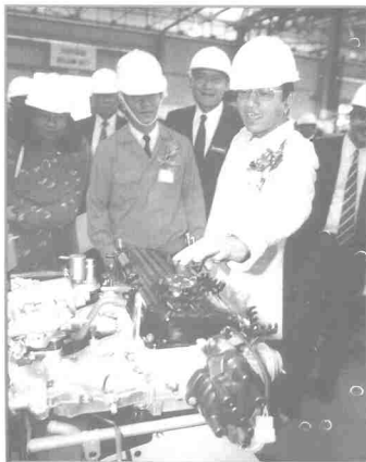
Ke arah wawasan 2020

masyarakat yang adil adalah pengagihan kekayaan yang adil dan saksama. Oleh itu terdapat dua strategi utama dalam pencapaian matlamat tersebut dengan membasmikan kemiskinan tanpa mengira kaum dan menghapuskan