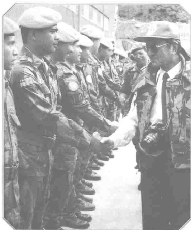
Bangsa yang kuat mampu mempertahankan negara

Bagi merealisasikan impian tersebut, ia memerlukan kecekalan dan keazaman tinggi. Malaysia mengamalkan sistem politik yang berpaksikan demokrasi.