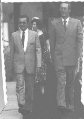
Berganding bahu dengan pemimpin Asean yang lain

Kawasan Pelaburan ASEAN (AIA) telah dimeterai oleh Menteri-menteri Ekonomi ASEAN pada 7 Oktober 1999. Tujuan penubuhan kawasan tersebut adalah untuk menggalakkan aliran masuk pelaburan langsung antara negara anggota atau bukan dari negara anggota sebagai satu wadah pelaburan