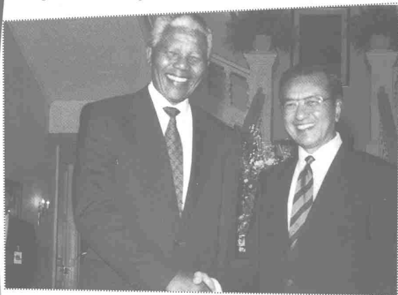
Hubungan rapat dengan Nelson Mandela

Tun Dr. Mahathir Mohamad turut melibatkan diri dalam United Nations Protection Force pada tahun 1992 yang bertujuan mengawasi gencatan senjata di Bosnia Herzegovina. Selain itu banyak