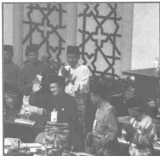
Pemimpin yang disegani

Selain itu, Tun Dr. Mahathir Mohamad mengingatkan supaya pemimpin-pemimpin muda tidak terlalu lantang untuk mempersoalkan sesuatu perkara yang berkaitan dengan semangat kemelayuan. Oleh itu dalam erti kata perjuangan UMNO juga turut memperjuangkan kepentingan kaum lain juga.