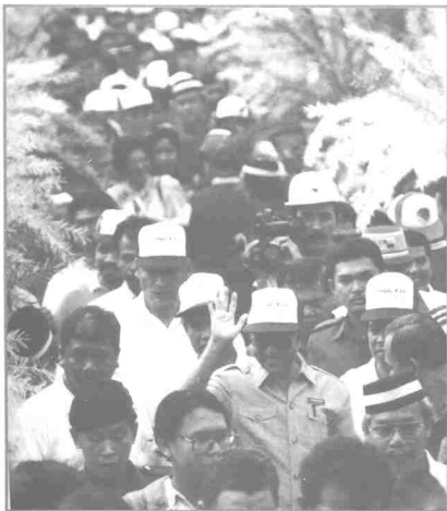
Program Bersama Rakyat (Semarak)

negara Asia Timur itu berbanding Barat yang mempunyai budaya yang kurang sihat.