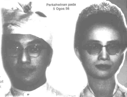
Perkahwinan pada 5 Ogos 56

Bagi Tun Dr. Siti Hasmah pula, sebagai seorang wanita, isteri dan ibu, beliau memainkan peranan penting dalam menerajui keluarga, memberi sokongan kepada suami dan menjalin hubungan mesra dengan rakyat.