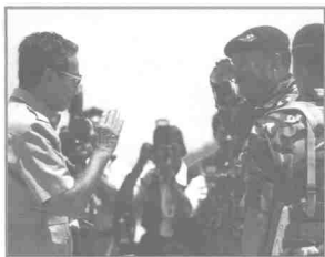
Turut membantu menjaga keamanan negara

tentang Tarif dan Perdagangan, dan Pertubuhan Perdagangan Sedunia (WTO).