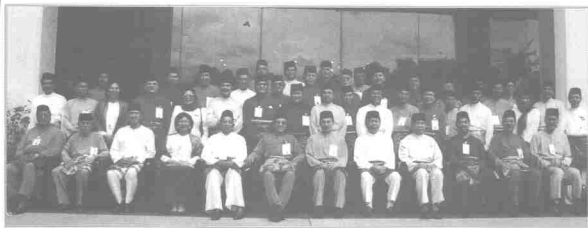
Bersama pemimpin-pemimpin UMNO yang menerajui negara

timbul. Antara masalah yang menjadi penghalang kepada perlantikan Tun Dr. Mahathir Mohamad sebagai Timbalan Perdana Menteri ialah kehilangan pemimpin besar UMNO. Kematian Tun Abdul Razak telah menyebabkan rakyat Malaysia begitu sedih. Lebih-lebih lagi ketika itu Dato' Harun Idris telah diheret ke mahkamah sehinggakan ramai pelajar ITM melakukan tindakan yang tidak beretika.