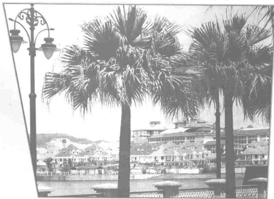
Putrajaya menjadi pusat pentadbiran berasaskan IT negara

Koleksi Tanaman Amerika mempamerkan pokok Amerika Tropika. Kebanyakan spesies diperkenalkan oleh orang Portugis dan Sepanyol pada abad