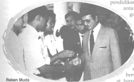
Rakan Muda pemangkin kemajuan golongan remaja

Program tersebut menyemarakkan gaya hidup yang berkualiti dan berwawasan yang