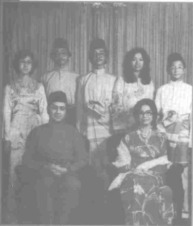
Bersama keluarga tercinta

oleh keluarganya untuk membantu beberapa kerja yang berfaedah. Misalnya beliau pernah menjual air, buah-buahan setiap hari Rabu di Pekan Rabu.