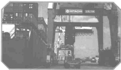
Menggalakkan pertumbuhan industri yang berdaya saing

Sejak terlancarnya Dasar Ekonomi Baru, ekonomi kaum Bumiputera mula mengorak langkah dan berkembang dalam