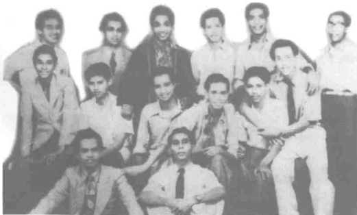
Bersama rakan-rakan seperjuangan

( Pada awal tahun 1940-an tidak ramai pelajar Melayu yang mengikuti kursus tersebut.) Pada (tahun 1947, hanya terdapat tujuh orang dan salah seorang daripadanya ialah Tun Dr. Siti Hasmah.)