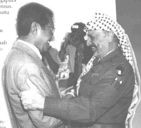
Sentiasa memperjuangkan hak-hak rakyat Palestin

Selain itu, Malaysia juga memberi sokongan kuat terhadap perjuangan rakyat Palestin. Oleh itulah Malaysia pernah menjadi tuan rumah persidangan Keserantauan Asia tentang nasib Palestin di Kuala Lumpur pada tahun 1983.