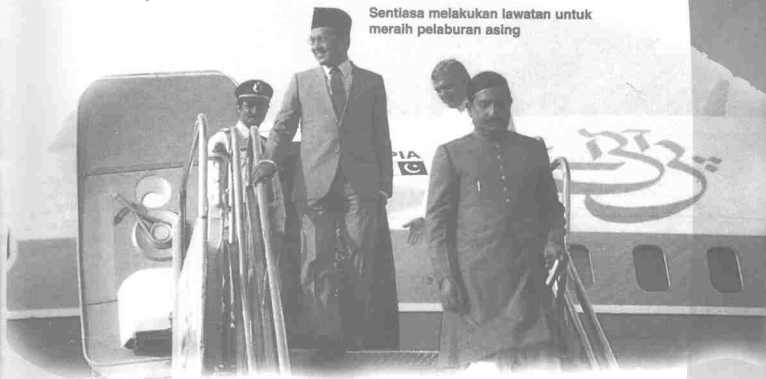
Sentiasa melakukan lawatan untuk meraih pelaburan asing

misi pelaburan diperoleh. Oleh itu ramai pelabur yang berminat melabur di Malaysia. Pada masa yang sama delegasi yang diketuai beliau turut memper-tajamkan lagi kefahaman tentang diplomasi ekonomi. Justeru itu pelaburan telah memberi ruang kepada banyak pihak, sama ada pihak swasta, bank, peniaga, ataupun rakyat Malaysia.