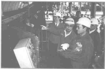
Pembangunan sains dan teknologi

kemiskinan secara menyeluruh, menumpukan pembangunan Bumiputera dalam bidang ekonomi, memberi penekanan sektor swasta supaya membantu menjana ekonomi negara dan membangun sumber manusia supaya mampu membangunkan negara secara terancang dan berterusan.