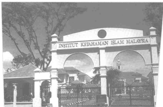
IKIM mengimbangi keperluan pembangunan dan keperibadian ummah

Kemudahan asas yang lengkap termasuklah jalinan jalan raya di seluruh negara. Hampir keseluruhan kawasan